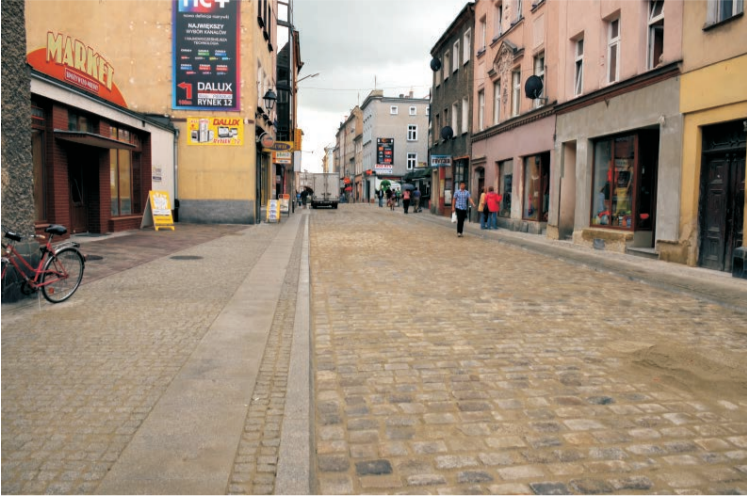
Przebudowano ulicę Kościuszki

W tym roku przebudowane zostały spore odcinki ząbkowickich ulic oraz wyremontowane w technologii asfaltowej drogi wiejskie w Olbrachcicach Wielkich, Braszowicach i Strąkowej, do których "dołożył się" kwotą ponad 670 tys. zł Urząd Marszałkowski. Z kolei Gmina pokryła 25% kosztów przebudowy drogi powiatowej z Tarnowa do Olbrachcic i po oddaniu do użytku jej dwukilometrowego odcinka powstał bardzo przyzwoity łącznik od krajowej ósemki do dróg wojewódzkich 385 i 382.