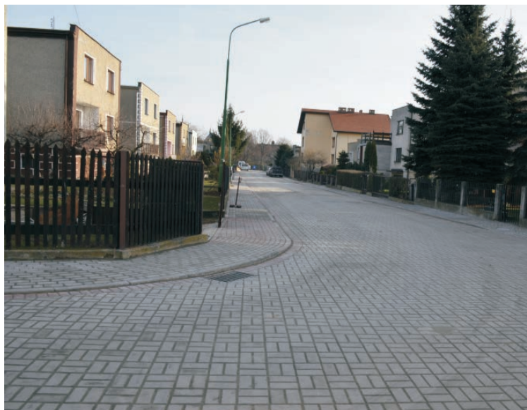
Z nowej ulicy cieszą się też mieszkańcy Okrężnej