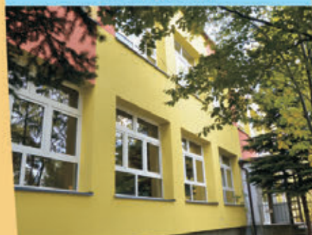
Termomodernizacja Przedszkola nr 4