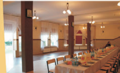
Wyremontowana świećlica w Braszowicach