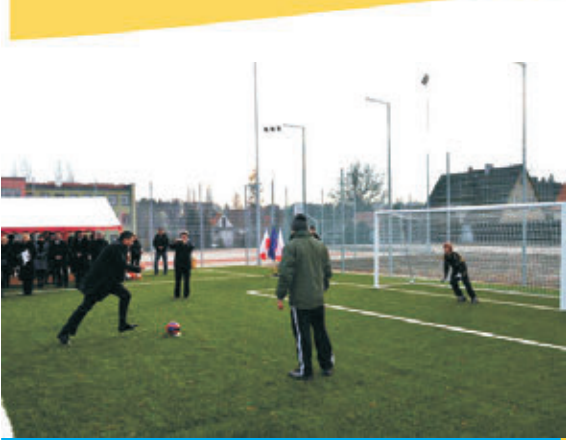
Pierwszego gola strzela burmistrz