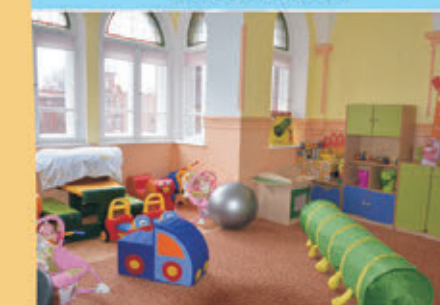
Adaptacja pomieszczeń dla grupy żłobkowej w PP nr1