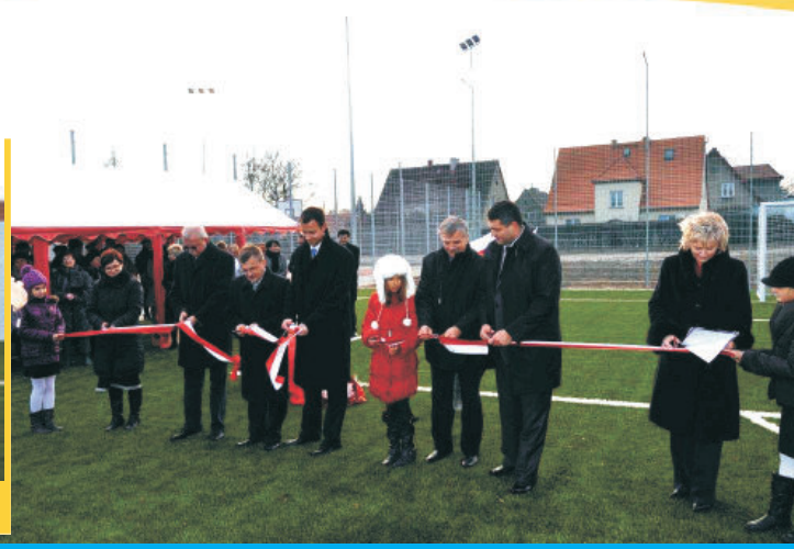
Uroczyste przecięcie wstęgi

Kompleks boisk „Orlik” przy SP nr 3 jest już oficjalnie otwarty. Uroczyste przecięcie wstęgi odbyło się w poniedziałek 12 bm. Dzieci, młodzież i wszyscy chętni mieszkańcy mogą już nieodpłatnie korzystać z nowych boisk. Zapraszamy!