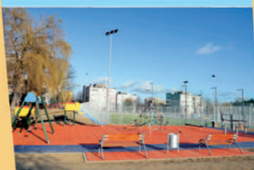
W mieście i na wsiach wybudowano siedem placów zabaw