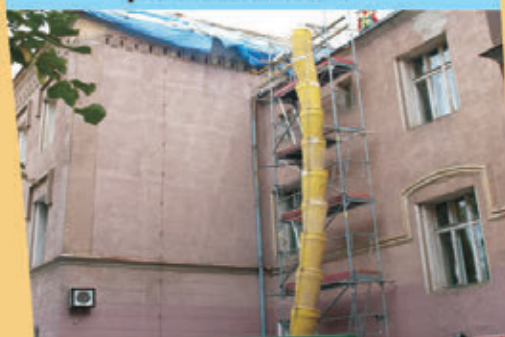
Remont dachu w SP nr 1