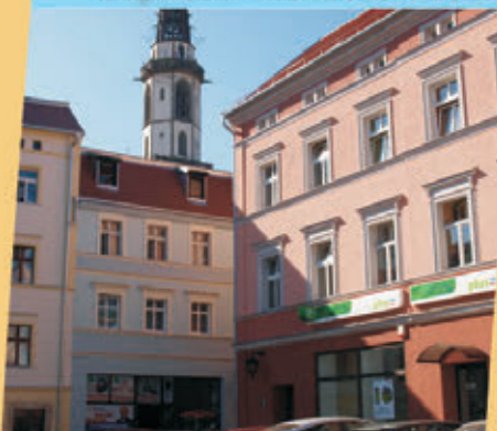
Rewitalizacja kamienic w Rynku