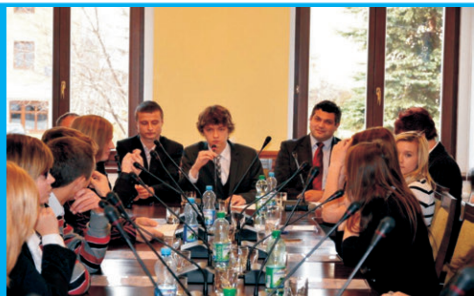
Młodzieżowa Rada Miejska podejmuje pierwsze uchwały

Pewną formą konsultacji społecznych są także cotygodniowe spotkania burmistrza z mieszkańcami w czasie przeznaczonym na przyjmowanie interesantów. Trudno w jednym miejscu omówić wszystkie rozwiązane problemy mieszkańców, tym bardziej, że często należą do nich sprawy bardzo osobiste. Przypominamy w tym miejscu, że Burmistrz przyjmuje mieszkańców w każdy wtorek od godz. 10 do 16.