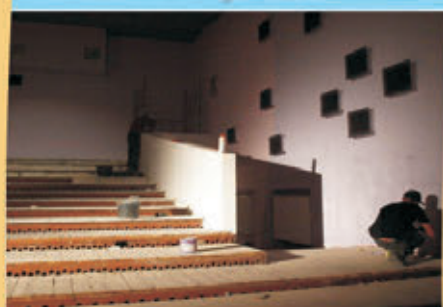
Remont sali kinowej w ZOK - u