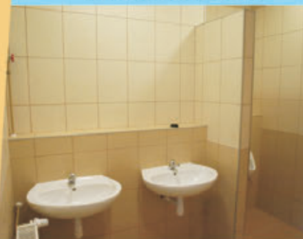
Nowe zaplecze sanitarne w SP nr 3