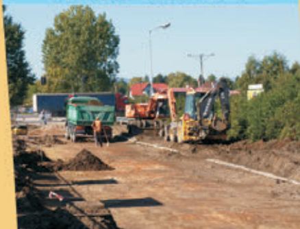
Remont ulicy Dalekiej