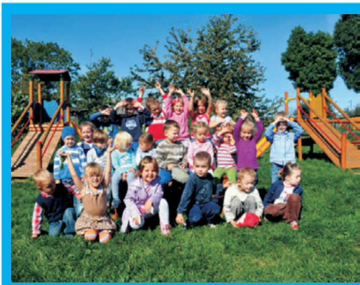
Dzieci z Bobolic cieszą się z nowego placu zabaw

Są to między innymi środki w ramach rządowego programu Maluch (wyremontowano i wyposażono pomieszczenia dla nowej grupy żłobkowej), z programu Odnowa Wsi Dolnośląskiej wyremontowano zaplecze sanitarne świetlicy w Sulisławicach. Dzięki programowi Odnowa i Rozwój Wsi możliwa była budowa placów zabaw dla dzieci w Stolcu, Bobolicach i Sulisławicach. Dzięki środkom zewnętrznym powstał drugi Orlik, wykorzystano dotacje z Wojewódzkiego Funduszu Ochrony Środowiska, z Narodowego Programu Przebudowy Dróg Lokalnych. Za pieniądze z programu „Radosna Szkoła” powstały kolejne place zabaw dla dzieci, a z funduszu Zajęć Sportowo-Rekreacyjnych nasi milusińscy mogą aktywnie spędzać czas wolny. Szkoły otrzymały również pieniądze na naukę pływania oraz indywidualizację procesu nauczania.