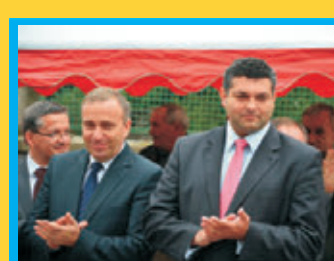
Grzegorz Schetyna otwiera nową drogę w Ząbkowicach

W wrześniu nową drogę w Ząbkowicach Śląskich otwierał Marszałek Sejmu, Grzegorz Schetyna.