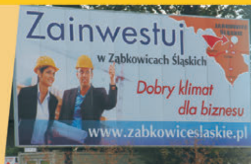
Do inwestowania w gminie zachęcają bilbordy