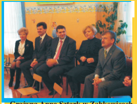
Grażyna Anna Sztark w Ząbkowicach

W lutym Ząbkowice Śląskie gościły Panią Lilję Jaroń, wiceminister Edukacji Narodowej oraz Panią Grażynę Annę Sztark, wice-marszałek Senatu RP. Przy