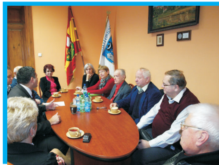
Spotkanie burmistrza z Radą Seniorów

Aktywność lokalnej społeczności to szansa na rozwój. Zapraszamy do współpracy wszystkich chętnych. Liczymy również na to, że wszelkie nieprawidłowości będą przez mieszkańców gminy bardzo szybko sygnalizowane.