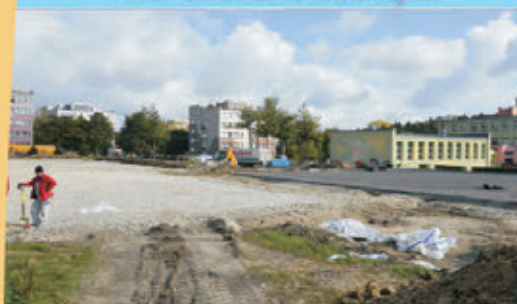
Budowa kompleksu boisk "Orlik"