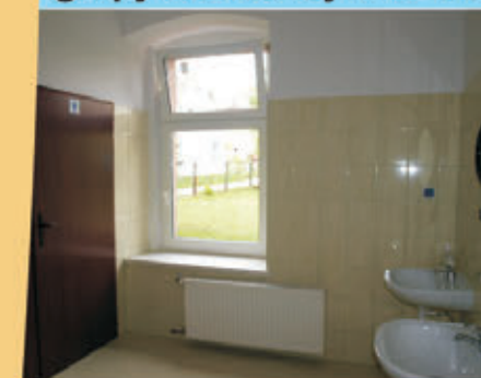
Nowe zaplecze świetlicy w Sulisławicach