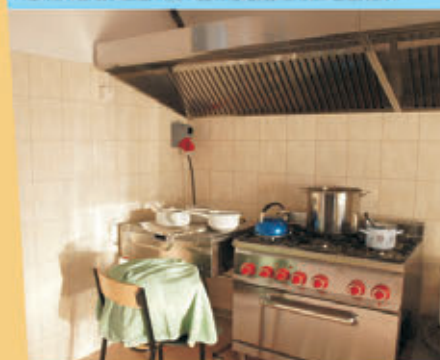
Zakupy wyposażenia do świetlic