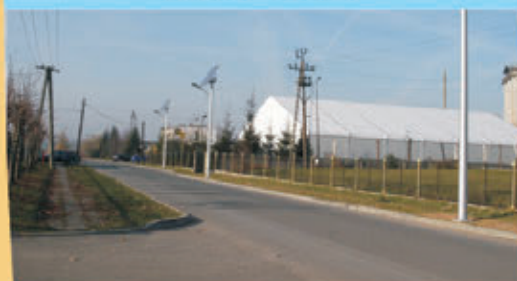
Nowe lampy solarowe w Ząbkowicach