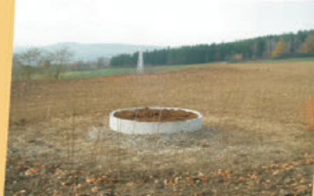
Rekultywacja składowiska odpadów w Braszowicach