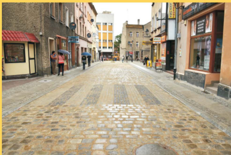
Dobiegł końca remont ulicy Kościuszki