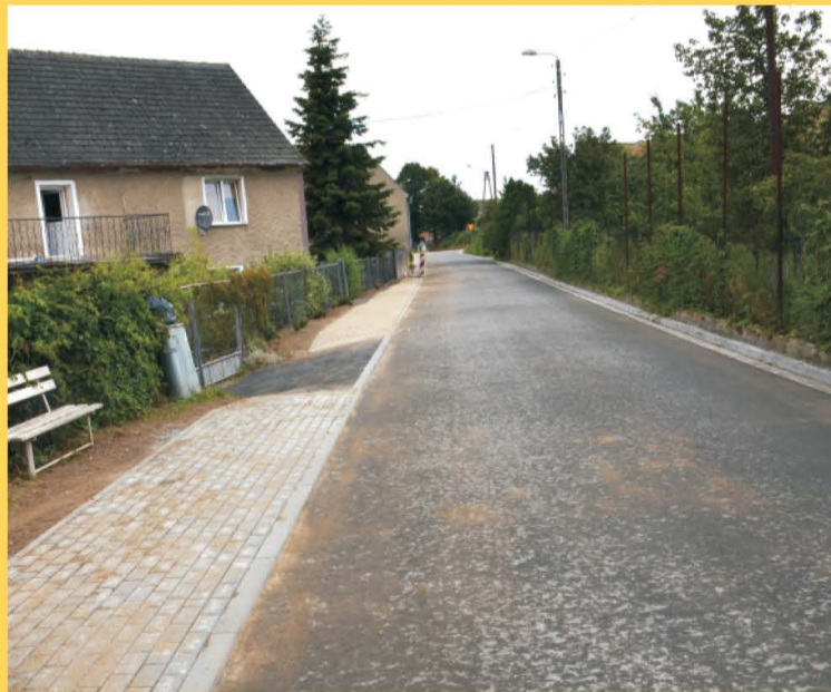
II etap remontu ulicy Spokojnej