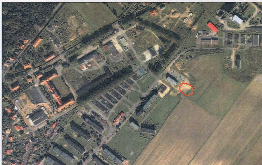
Zdjęcie nr 3. Lokalizacja działki na terenie Ząbkowic Śląskich

A handwritten signature in blue ink, consisting of a stylized, elongated shape with a vertical line through it.